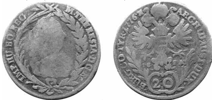
obr. č. 5

Naopak již v roce 1765 se objevuje razba se závojem, ale ještě bez zn. mincmistra (Sch, Cej, Her, MN, VN i Eyp). Tedy po 18. srpnu 1765, kdy zemřel její manžel. Je poměrně vzácná (obr. 6), na rozdíl od skoro nejběžnějšího ročníku 1765 bez závoje.