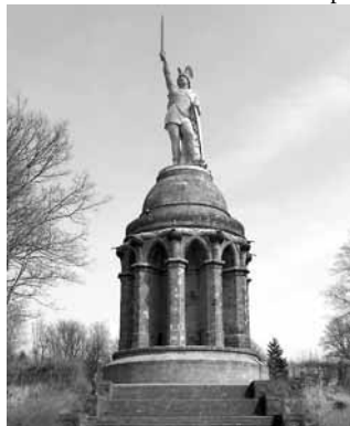
V roce 1836, v období silícího německého nacionalismu, byl vybudován památník na místě bitvy u Teutoburského lesa (nedaleko města Detmold). Arminius, kterého si Němci překřtili na Hermanna, tu hrozí mečem novému nepříteli – Francii.