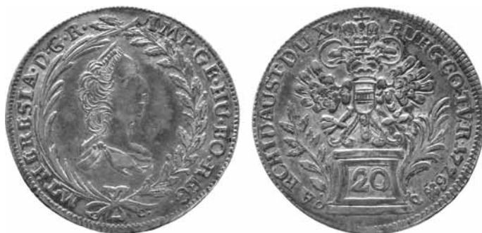
obr. č. 2