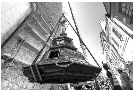
oprava horní části věže s makovíci