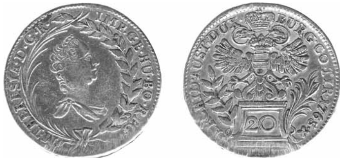
obr. č. 3