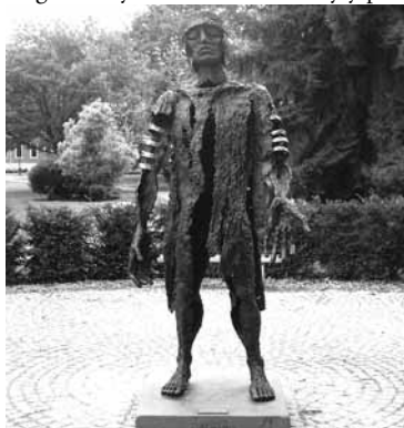
Bronzová socha „Poražený Verus“ od Wilfrieda Kocha v Haltern am See (Německo) z roku 2003.

drtivou porážku. Po bitvě na pláni Idistavise na pravém břehu řeky Vesery v roce 16 po Kr. Řím definitivně ztratil Germánii. Germanicus stáhl všechny jednotky z Germánie. Při cestě zpět našli dvě ze tří legionářských standard, které byly předvedeny při Germanicově triumfu 26. května 17 po Kr.