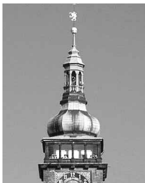
Bílá věž před opravou

Šůla, J. 1976: Příspěvek k problematice variant ornamentů slezských grešlí Leopolda I. Numismatické listy 31, 45–55.