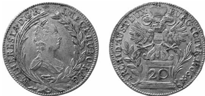
obr. č. 1

Dvacetník z roku 1776 bez závoje (MN, VN, Eyp) se mi podařilo získat do sbírky (obr. 2) a mohu ho tedy porovnat s originály (obr. 3). Jedná se o falsum, jak již uvádí Cej. Je to velice kvalitní napodobenina, která v dané době dobře sloužila k oklamání spotřebitele. Nebyť trochu setřelého postříbření, tak i dnes zmýlí spoustu sběratelů. Jen proto, že dvacetníky již delší studuji a mám je "v oku", tak mi tato mince byla hned nápadně podezřelá svým rázem. Když pomínu jiný typ mince neodpovídající tomuto roku, jde o ražbu z částečně puncovaných razidel - viz vavřínové lístky, poškozená horní příčka u písmene E, dvojráz u číslice 7 a 20 a pod. Z provedení falsu je vidět, že rytec