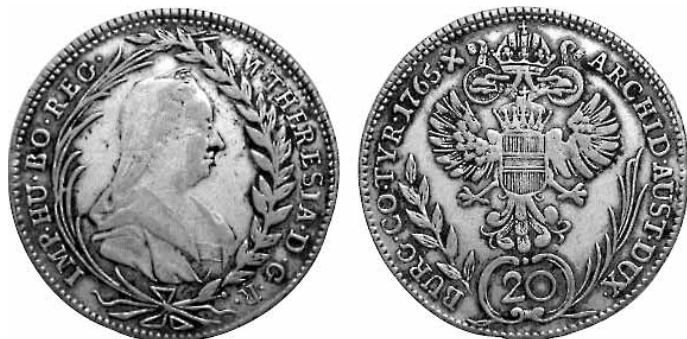
obr. č. 6