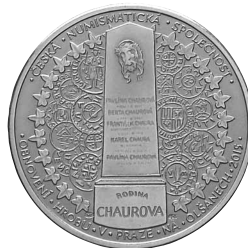
Medaile vydaná k příležitosti opravy hrobu rodiny Chaurů autor Vladimír Oppl, raženo ve stříbře 0.925 a v bronzu, průměr 30 mm